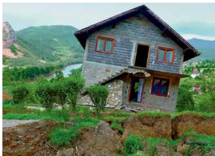
Im Kosovo und in Bosnien-Herzegowina haben Naturgefahren-Fachleute aus der Schweiz die vor Ort Verantwortlichen nach Naturereignissen mit ihrem Know-how unterstützt.