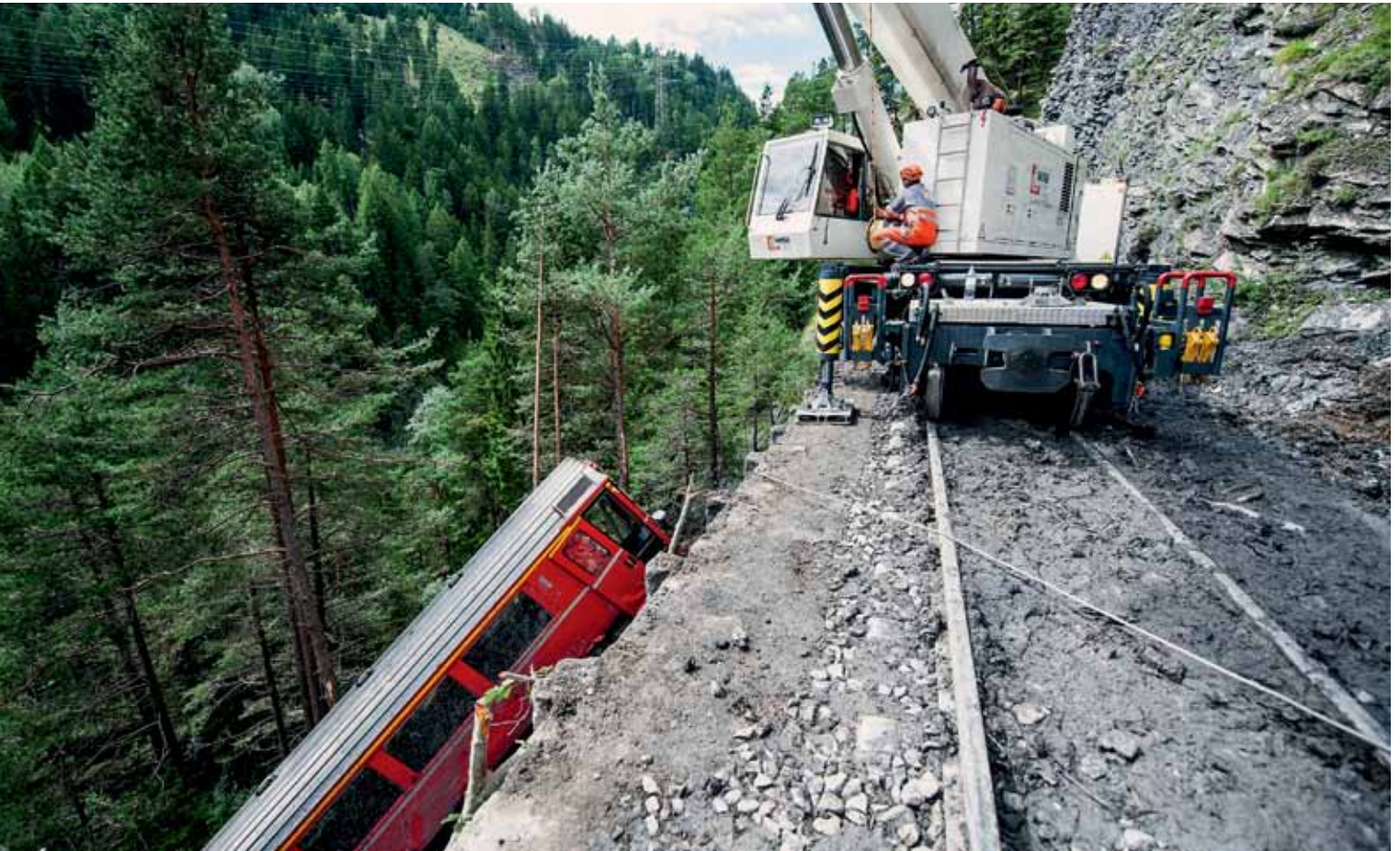
Effiziente Bergungsarbeiten nach dem Unglück eines Personenzugs, der an einem Steilhang bei Tiefencastel (GR) auf einen Erdbeben auffuhr.