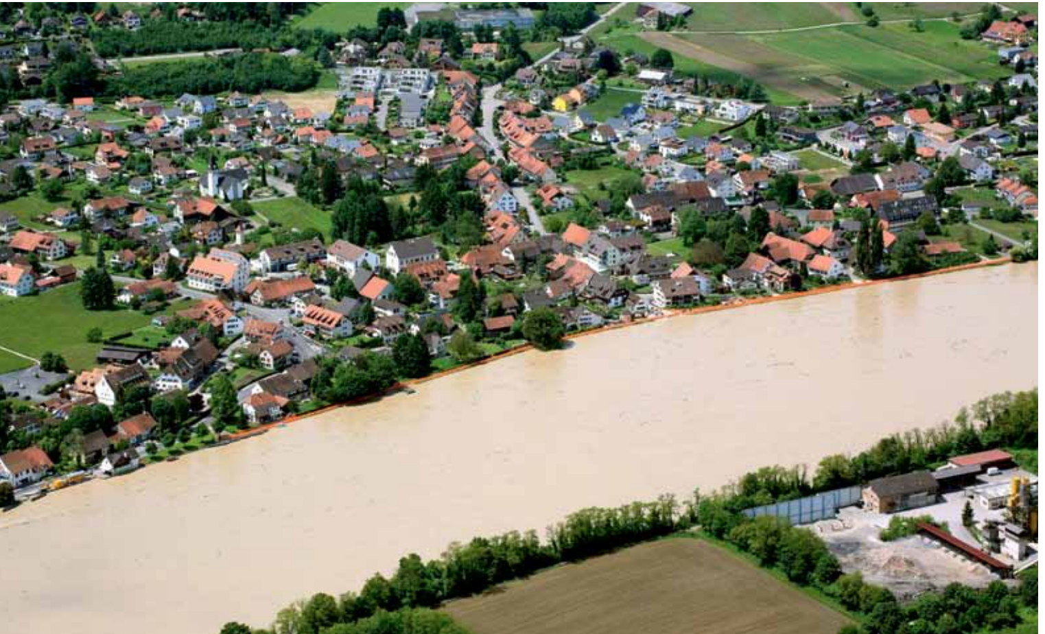
Mobiler Hochwasserschutz: Beaver-Schläuche schützten die ufernahen Gebäude von Wallbach (AG) im Juni 2013 erfolgreich vor dem hochgehenden Rhein.