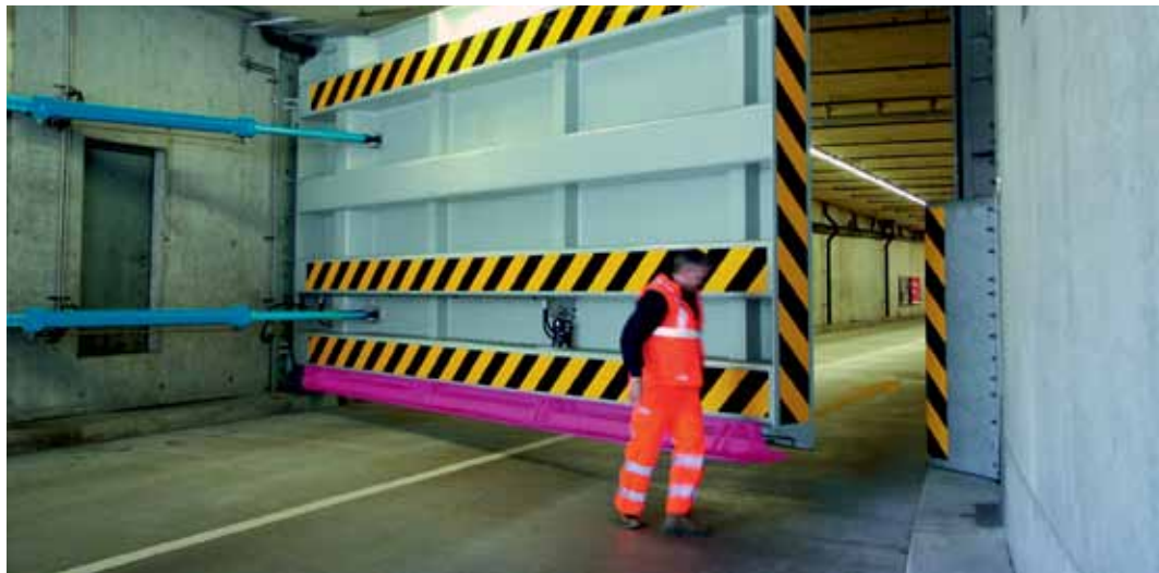
Neues Hochwassertor zum Schutz eines unterirdischen Parkhauses in der Zürcher Innenstadt.

Hausbesitzer, Eigentümer von Objekten mit Sonderrisiken sowie Infrastrukturbetreiber konnten sich dank Briefen, Informationsanlässen und Beratungsgesprächen ein konkretes Bild des Risikos und möglicher Schutzmassnahmen machen. Aufgrund von überzeugenden Kosten-Nutzen-Analysen ist es der GVZ