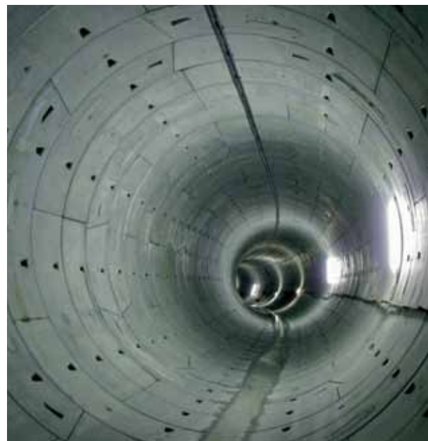
Steigt der Thunersee rasch an, dient der Stollen zur Entlastung der Aare.

Der Rückversicherer Swiss Re beziffert allein den 100-jährlichen versicherten Ereignisschaden für Hochwasser im Inland auf 4,4 Milliarden Franken. Bei einer Wiederkehrhäufigkeit von 250 Jahren könnten die Gesamtschäden durch überschwemmte Gebäude und zerstörtes Mobiliar sogar 7,8 Milliarden Franken erreichen. Nicht einkalkuliert sind dabei Beeinträchtigungen von Infrastrukturanlagen wie Strassen, Bahngleisen und Leitungsnetzen sowie Betriebsausfälle und weitere Schadenkosten. Weil die Wertkon-