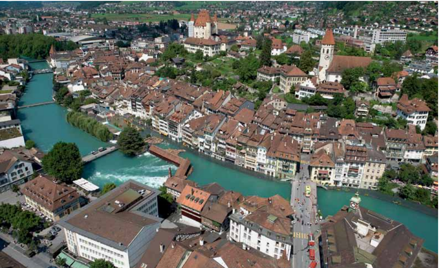
Dank einem Entlastungsstollen ist die Stadt Thun heute besser vor Überschwemmungen geschützt als im Hochwasserjahr 2005.