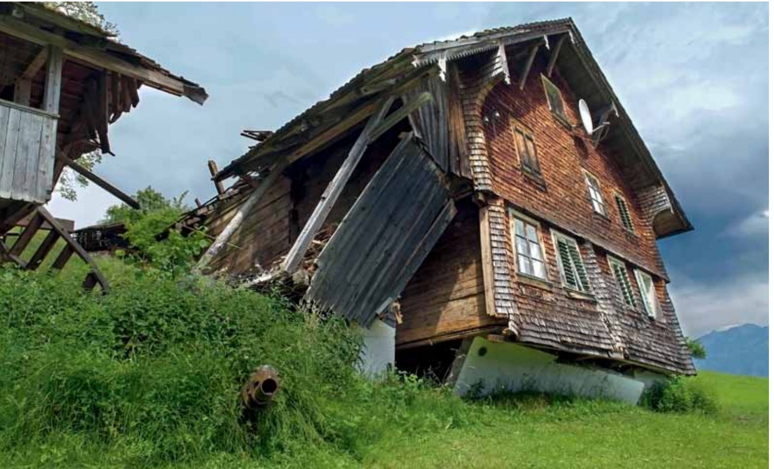
Durch grossräumige Rutschungen gefährdete Gebiete – wie der Ortsteil Hintergraben in Sarnen (OW) – sollen künftig nicht mehr überbaut werden.