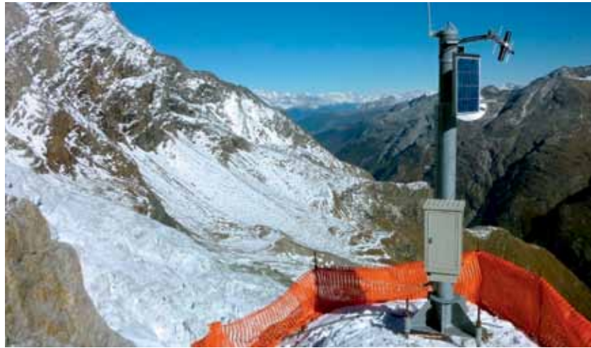
Am Regulierwehr in Port bei Biel lassen sich die Wasserstände der drei Jurarandseen und der Aare vorsorglich steuern. Die Warnanlage in einer Steilstufe des Bisgletschers oberhalb von Randa (VS) löst bei Lawinen und Eisabbrüchen einen Alarm aus.

für Menschen im Freien eine erhebliche Verletzungsgefahr. Auf Initiative der PLANAT und im Auftrag des Bundesamtes für Umwelt (BAFU) haben Fachleute im Jahr 2014 nun erstmals Karten der Sturmgefährdung in der Schweiz für verschiedene Wiederkehrperioden erstellt. Dabei werden auch die Unsicherheiten bei der Abschätzung dargestellt. Die flächendeckende Analyse dient fortan als Grundlage, um beispielsweise den Winddruck auf Gebäude abzuschätzen und die Baunormen weiterzuentwickeln. Auch will man potenzielle Auswirkungen auf sturmempfindliche Ökosysteme wie exponierte Wälder und Schilfbestände an den Ufern von Seen voraussagen können.