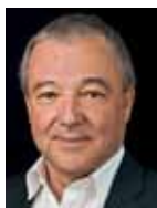
Andreas Götz, Präsident PLANAT, Bundesamt für Umwelt BAFU, Ittigen